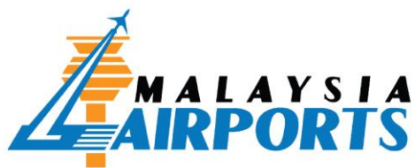
Malaysia Airport Holding Berhad