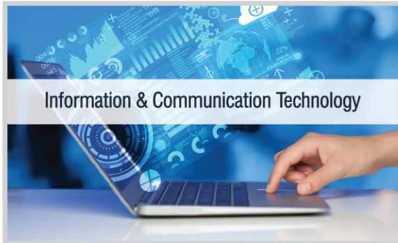
Information & Communication Technology