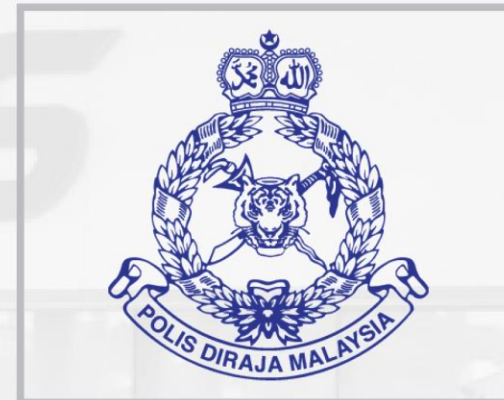
Royal Malaysia Police