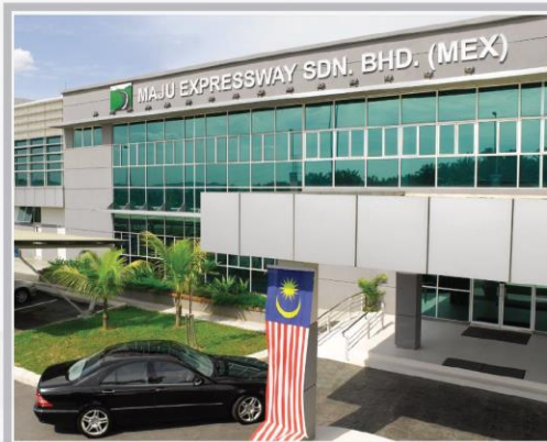
Maju Expressway Sdn Bhd