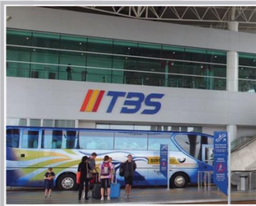
Terminal Bersepadu Selatan (TBS)